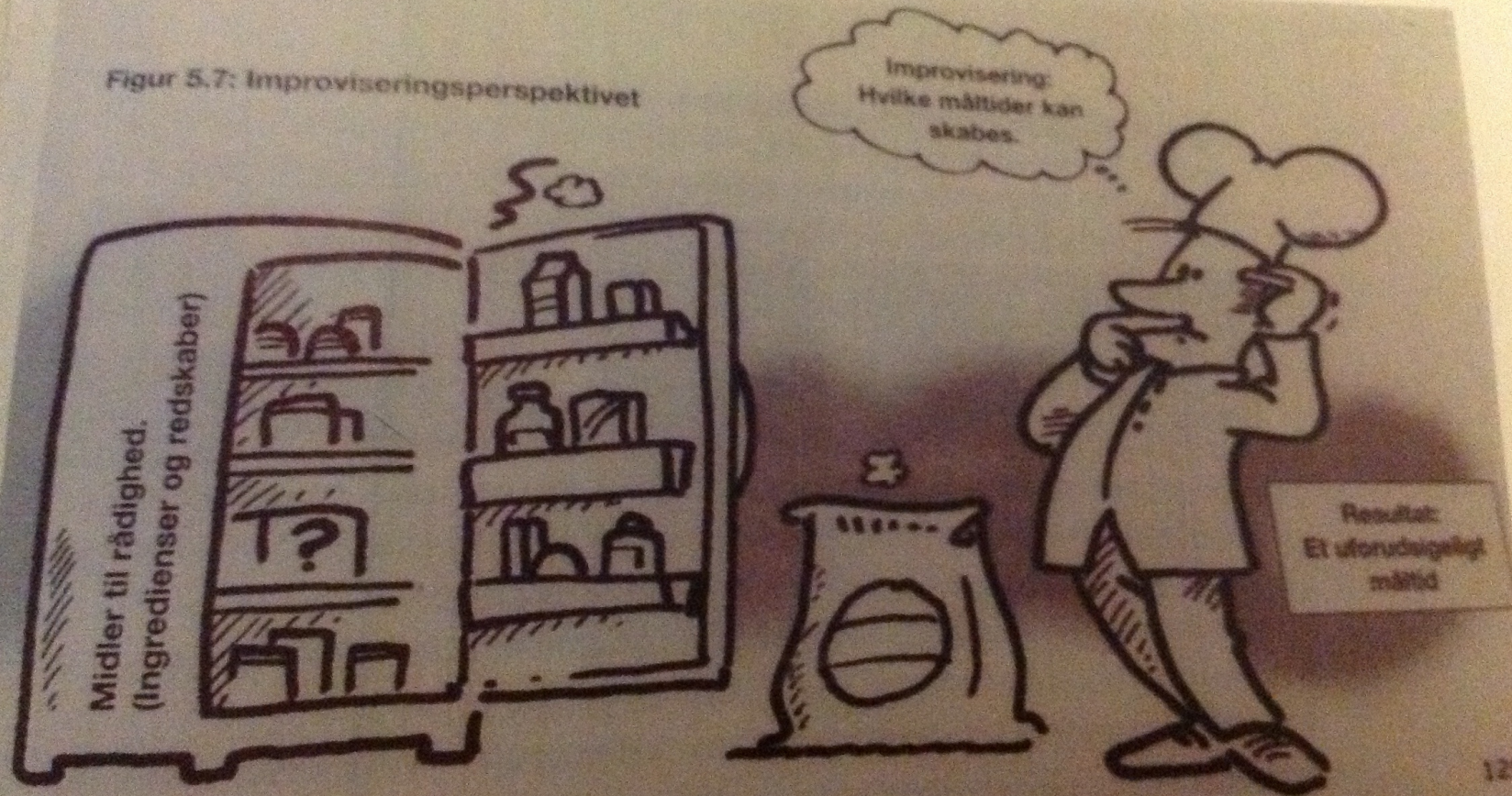
Figur 5.7: Improviseringsperspektivet